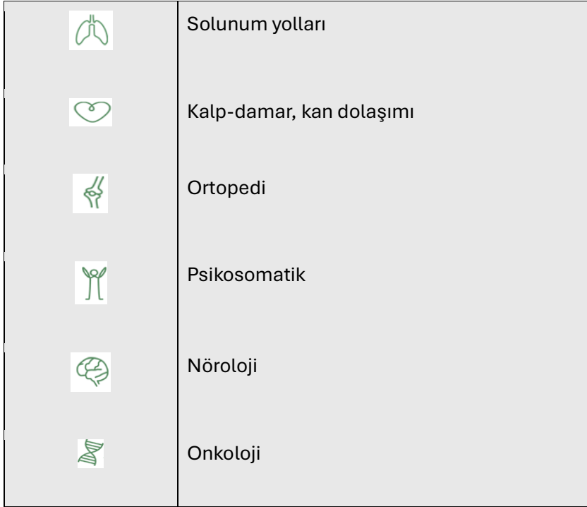
Tablo 1: Mecklenburg-Vorpommern eyaletinde şifa ve kür ormanlarında yönlendirme tabelalarındaki semboller

Almanya'nın kuzeyinde bulunan Heringsdorf kıyı ormanı kür ve şifa ormanına güzel bir örnek. "Yeşil eczane" olarak da nitelenen ormanlar zihni temizliyor, canlandırıyor ve tazeliyor. Heringsdorf kıyı ormanında 187 hektar alanda bilinçli olarak şifa gücü kullanılıyor. Burası 2016 yılının Kasım ayından bu